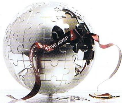
Cartier Women's Initiative Awards